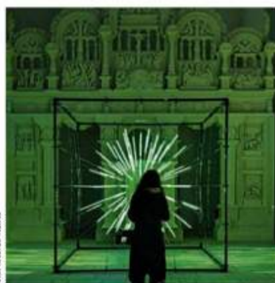
018 News LichtRouten in Lüdenscheid