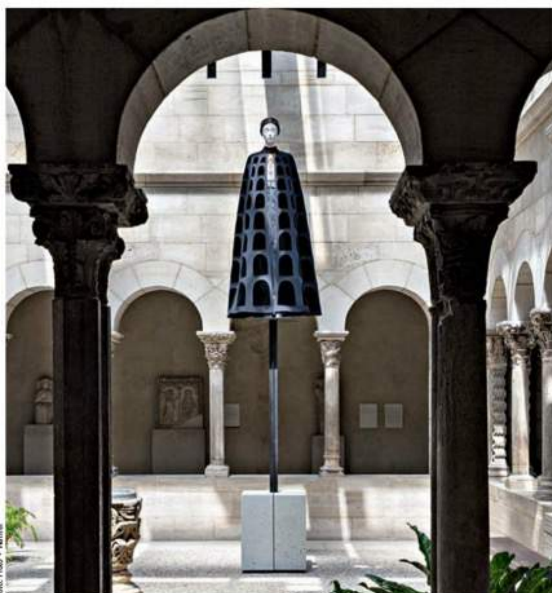
146 Foto • Raum Heavenly Bodies in New York