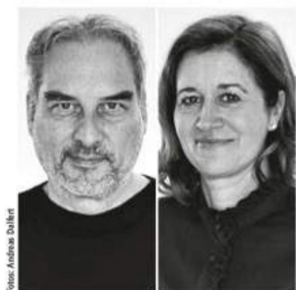
014 Im Vorstellungsgespräch Lohrmann Architekten

Beilagen: AIT-Dialog Teilbeilagen: Syma System, Architect@work Wien