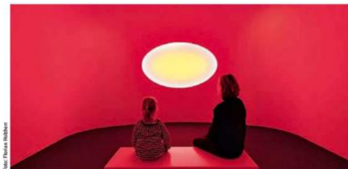
020 Terminkalender James Turrell in Baden-Baden