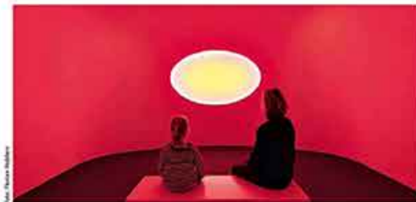
020 Terminkalender James Turrell in Baden-Baden