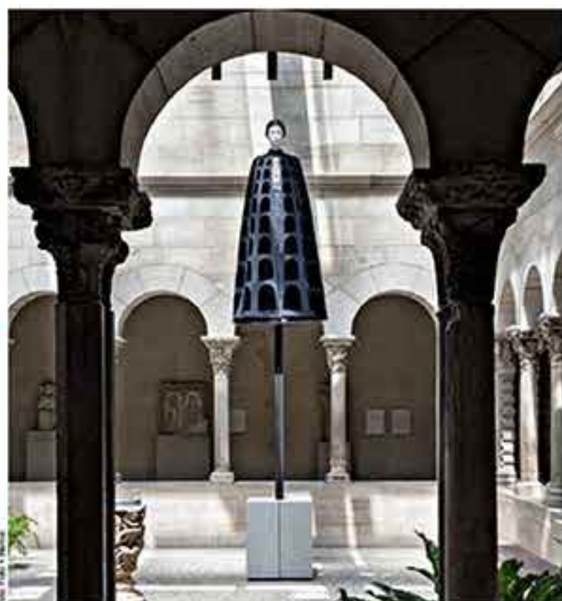
146 Foto • Raum Heavenly Bodies in New York