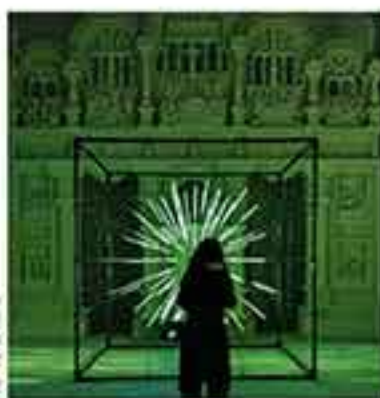
018 News LichtRouten in Lößenscheid