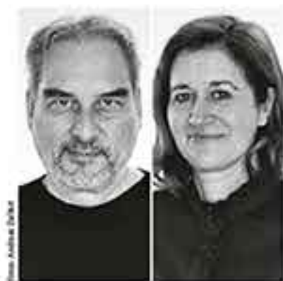
014 Im Vorstellungsgespräch Lohrmann Architekten

AIT 9.2018 Architektur • Innenarchitektur • Technischer Ausbau Mit den Nachrichten des bdiA bund deutscher Innenarchitekten Titelbild: Laura Zalenga, Biberach Heftdesign: Münster von Hammerstein/Raphael Pohlend, Stuttgart Beilagen: AIT-Dialog Teilbeilagen: Syma System, Architect@work Wien